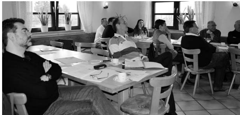
Hauptausschuss-Tagung zum Thema Finanzen: ein Samstag ganz im Zeichen der Zahlen.

Finanzklausur sucht Ansätze, um »die Decke« länger zu machen.