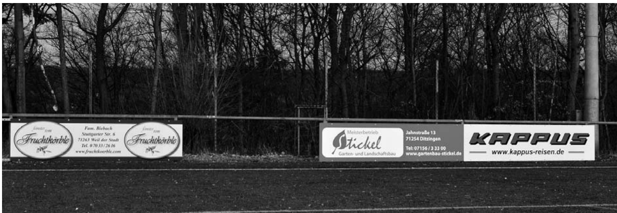
Die ersten Tafeln hängen bereits und finden viel Beachtung

Attraktive Werbemöglichkeiten mitten im sportlichen Geschehen.